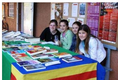
La parada de llibres també va ser protagonista de la diada a l'EPIC Casino

donar una ambientació ben especial a les nostres instal·lacions. Us oferim també en aquest butlletí les narracions guanyadores d'aquest concurs literari que tindrà continuïtat els propers anys, i al qual ja ara us animem a presentar-vos.