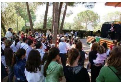
Els actes del 27 d'abril van acollir una alta participació de públic

■ El propassat 27 d'abril vam celebrar a les nostres instal·lacions de Matadepera la Festa de les diades de Sant Jordi i la Mare de Déu de Montserrat, amb un èxit de participació que ens va sorprendre a tots atès el poc temps que vam tenir per anunciar l'acte, i que ens demostra les ganes que tenen els nostres socis de participar en les activitats del Club. La jornada