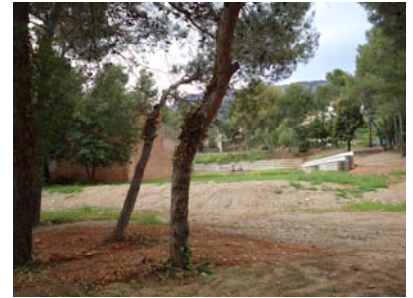
El torrent cobert i net ofereix un nou espai útil. Vista des del pavelló. Al fons l'espai de joc infantil