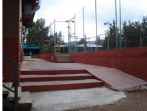
El corredor de la pista de petanca