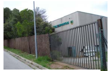
Nova porta i filat a l'entrada del pavelló